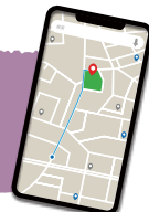
▲濱松街中デジタルマップはこちらから

また、ドラマ館入場者様等への、まちなか各店舗でのサービス情報も掲載していますので是非ご利用ください。